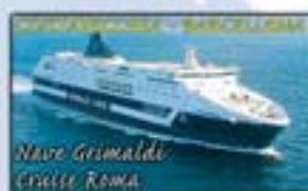
Nave Grimaldi Cruise Roma